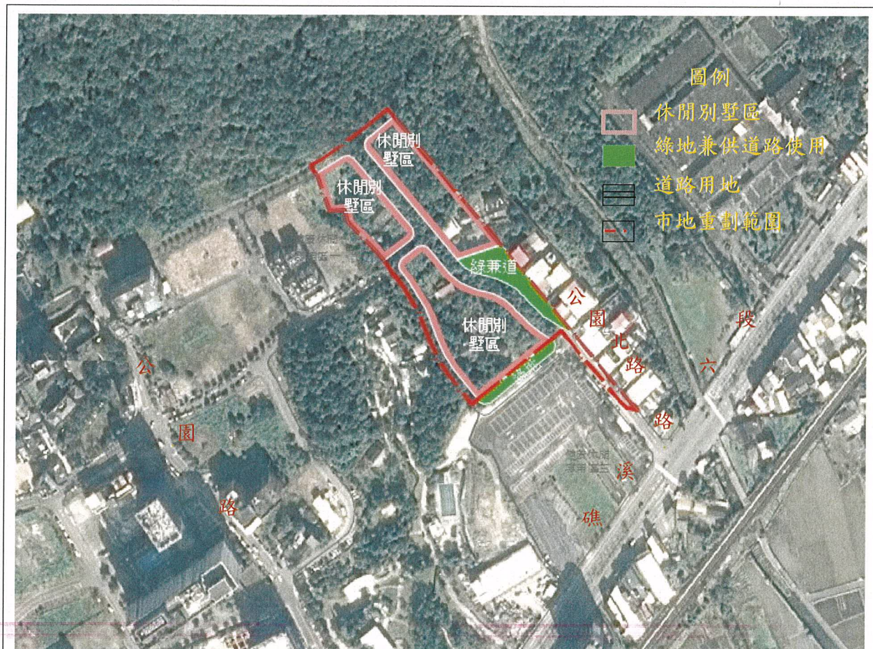
圖 1 計畫範圍示意圖